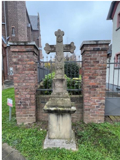
(Titelfoto: Kreuz an St. Mariae Geburt)